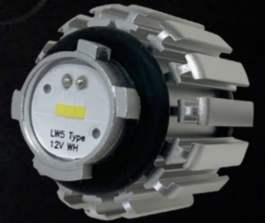
交換用ハイパワーバルブ LW5タイプ